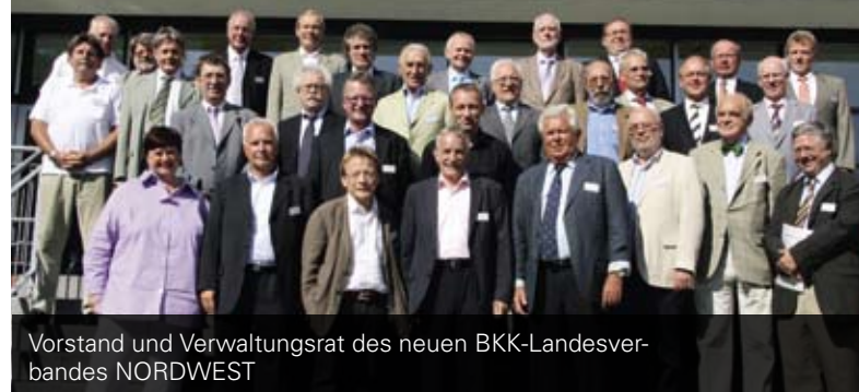
Vorstand und Verwaltungsrat des neuen BKK-Landesverbandes NORDWEST

Mit Beschluss der Sitzung vom 7. Juli 2010 des gemeinsamen Verwaltungsrates ist der Zusammenschluss der beiden BKK Landesverbände Nordrhein-Westfalen und NORD zum BKK-Landesverband NORDWEST vollzogen. Der neue Verband vertritt 41 Betriebskrankenkassen in Hamburg, Mecklenburg-Vorpommern, Schleswig-Holstein und NRW. Knapp 4 Mio. Einwohner sind in dem neuen Verbandsgebiet in einer Betriebskrankenkasse krankenversichert. Die bisherigen Standorte Essen und Hamburg werden beibehalten, um die gute Betreuung der Betriebskrankenkassen und ihrer Versicherten im Zusammenspiel mit den regionalen Partnern wie Ärzten, Apothekern oder Krankenhäusern weiter zu gewährleisten.